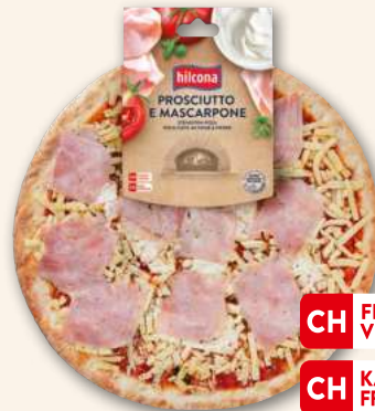
Pizza Prosciutto & Mascarpone Prosciutto mit extra Cremissimo. 405 g, 919877 MHD 8 Tage