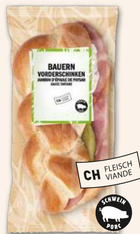
Zöpfli Bauernvorderschinken mit Tartaresauce Cremig, deftig und unwiderstehlich.