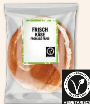
Schneck Frischkäse Bringt den Tag ins Rollen.