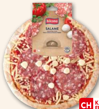
Pizza Salame Das ist Bella Italia auf einer Pizza! 410 g, 942971 MHD 8 Tage