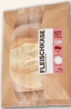
Fleischkäse Semmel Der „Burger“ aus den Alpen. 175 g, 934778 MHD 3 Tage