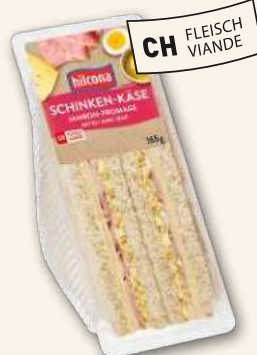
Clubsandwich Schinken-Käse Eines der beliebtesten Dreiecke.