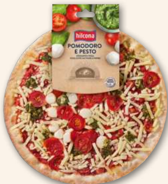
Pizza Pomodoro & Pesto Abwechslung? Mit Pesto perfetto! 420 g, 878788 MHD 8 Tage

Attraktive Produktoptik durch knusprig gebräunten Teig. Authentischer Geschmack dank dünnem Boden und feinen Zutaten. Volle Produkteinsicht für Frische- und Qualitätsnachweis.