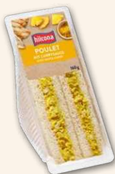
Clubsandwich Poulet-Curry Oder ein Biss'chen indischer.