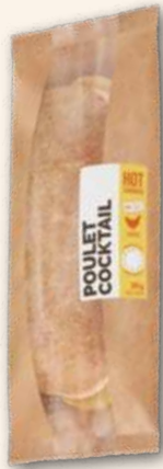
Poulet Cocktail Hat Cremigkeit im Griff. 245 g, 943121 MHD 3 Tage

Hot Sandwiches erwärmen angenehm den Magen, da greifen Ihre Kunden gerne zu. Eine Auswahl aus den beliebtesten Sandwich-Klassikern versprechen schnellen Dreh!