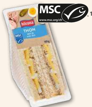
Clubsandwich Thon Davon will man Meer.