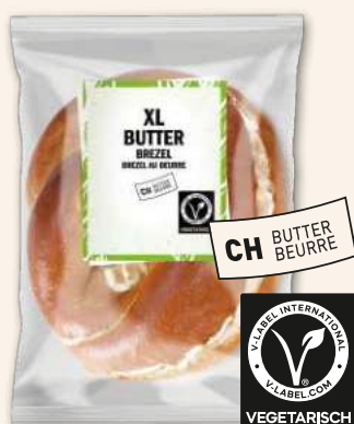
XL Butter Brezel Laugig. Buttrig. Lecker.

Länger haltbar für besseres Handling am POS