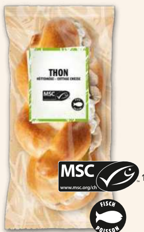
Zöpfli Thon mit Hüttenkäse Meergenus trifft Bergspezialität.