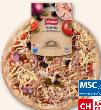
Pizza Tonno Bester Fang für mediterranen Genuss. 450 g, 895457 MHD 10 Tage