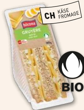
Clubsandwich Bio Gruyère-Ei Weil's (biologisch) schmeckt.