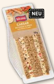
Clubsandwich Caesar Mit Poulet und Speck. Ein italoamerikanischer Klassiker.