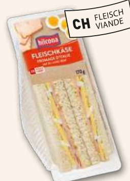
Clubsandwich Fleischkäse Währschaft und bodenständig.