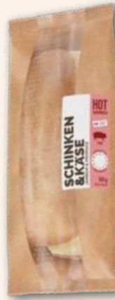
Schinken Käse Belegt immer vordere Plätze. 185 g, 943113 MHD 3 Tage