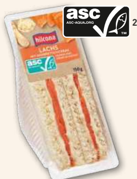
Clubsandwich Lachs Zum Glück kein Häppchen.