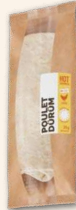
Hot Dürüm Die geniale Döner-Rolle. 215 g, 946277 MHD 3 Tage