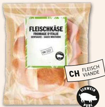
Ticinelli Fleischkäse mit Senfsauce Bissen für Bissen ein Genuss.