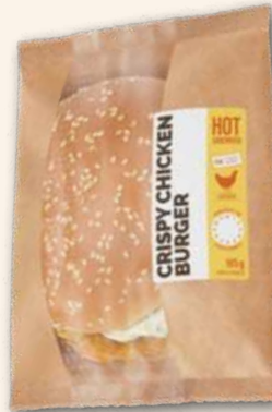
Crispy Chicken Burger Genauso knusprig wie genussvoll. 185 g, 951447 MHD 3 Tage