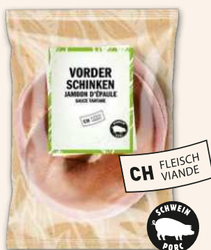
Brezel Vorderschinken mit Tartaresauce Brezelspass für die kleine Pause.