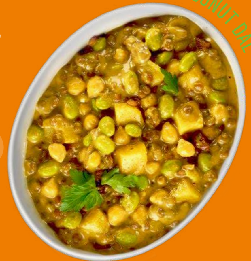
INDIAN COCONUT DAL