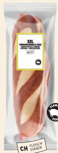
Pain de Sils XXL jambon-fromage