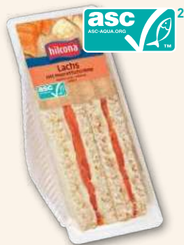
Club sandwich Saumon Irrésistiblement gourmand. 150 g, 919578 DLC 9 jours