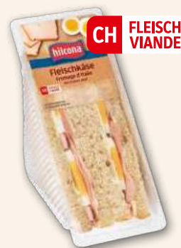
Club sandwich Fromage d'Italie Généreux et traditionnel. 170 g, 894358 DLC 9 jours