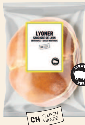
Petit pain à la saucisse de Lyon