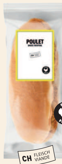
Bun poulet cocktail