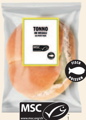
Petit pain au thon MSC

Pour la rotation et les achats impulsifs