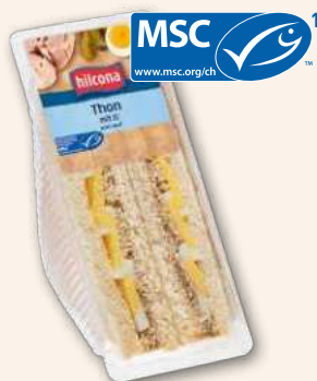
Club sandwich Thon Les saveurs de la mer. 165 g, 919594 DLC 8 jours