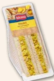
Club sandwich Poulet avec sauce curry Un peu d'Inde en bouche. 160 g, 919586 DLC 9 jours