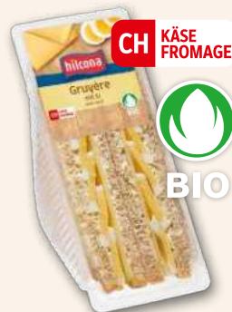
Club sandwich Gruyère avec oeuf bio Parce qu'il est (bio)logiquement bon. 160 g, 929194 DLC 7 jours