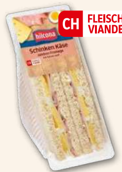
Club sandwich Jambon Fromage Un des triangles les plus populaires. 165 g, 919607 DLC 8 jours