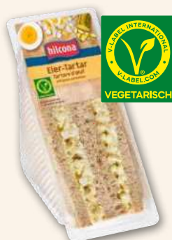
Club sandwich Tartare d'oeuf végétarien Végétarien pour la diversité. 155 g, 937215 DLC 8 jours