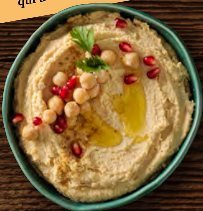
Ventes de houmous sur le marché global en tonnes

Le houmous, une tendance qui a le vent en poupe!